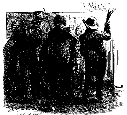
„Wij schreeven ook met het stukje rood krijt.”